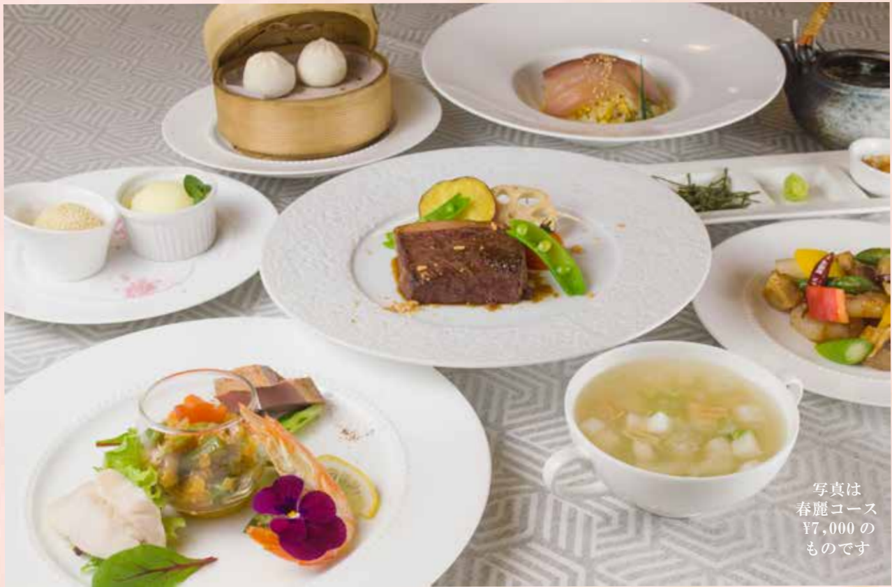
写真は 春麗コース ¥7,000の ものです

大切な方との新しい出会いを祝い、 思い出に残るひとときを ホテルのレストランでお過ごしく下さい。