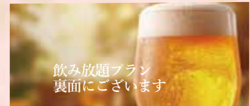
飲み放題プラン 裏面にご覧下さい

大切な方との新しい出会いを祝い、 思い出に残るひとときを ホテルのレストランでお過ごしく下さい。